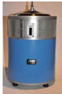
EX 220 C40