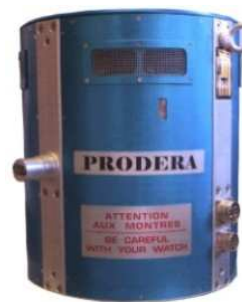
EX 520 C50