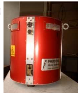
EX 1070 C50

Les excitateurs types EX 58 C40 et EX 220 C40 sont compatibles avec les amplificateurs standard types A 735 et A 648 S et sont par conséquent entièrement interchangeables avec les modèles plus anciens EX 58 et EX 220 SC.