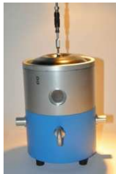
EX 58 C40